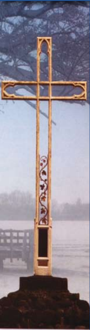
Krzyż misyjny nad jeziorem Niegocin