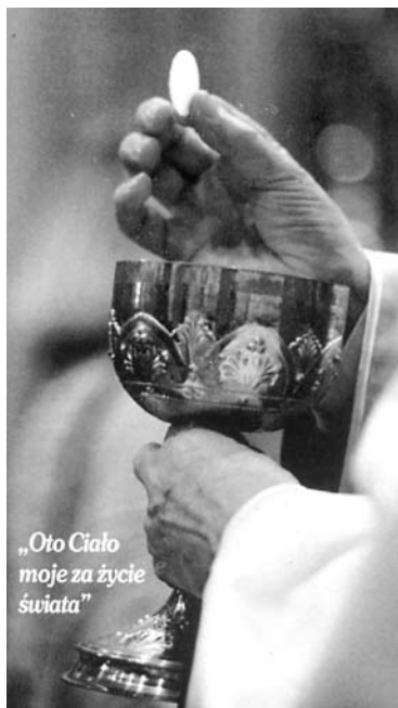
„Oto Ciało moje za życie świata”