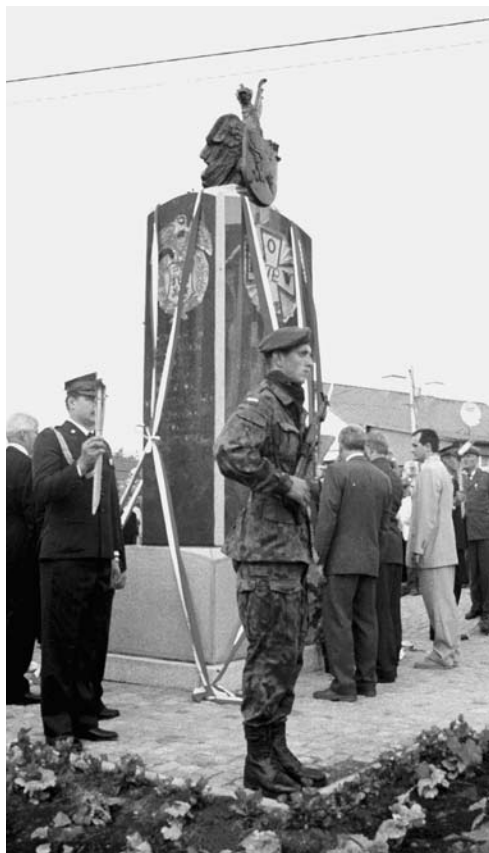
Rok 1999, odsłonięcie pomnika.

Uroczystość 90 rocznicy Powstania Sejneńskiego obchodzimy w niedzielę, 23 sierpnia – uroczysta Msza św. w intencji poległych powstańców oraz o pokój zgodę między narodami będzie o godz. 11.00.