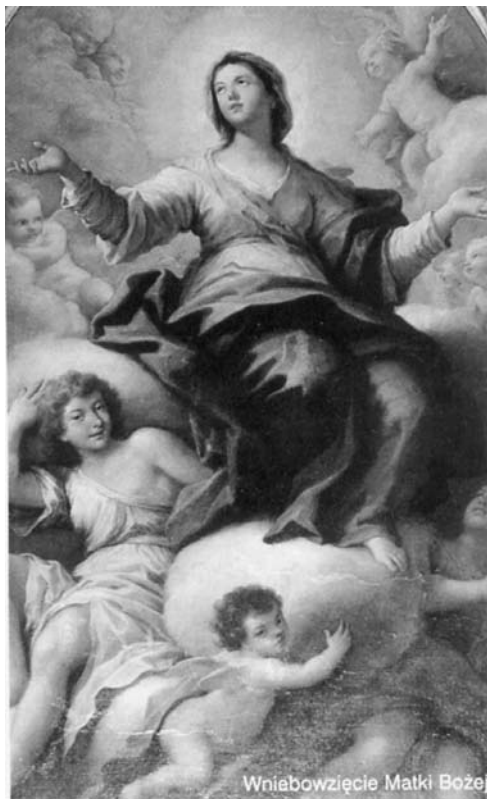
Wniebowzięcie Matki Bożej

Wniebowzięcie Matki Najświętszej to wywyższenie ludzkiej natury. Wystarczy na Nią spoglądać, by nauczyć się, jak przeżywać codzienność. Bo do nieba pielgrzymuje się przez zwyczajne życie. Czy starasz się w swoich kolejnych dniach, czasem szarych i monotonna, ujrzeć drogę, którą pielgrzymujesz do domu Ojca?