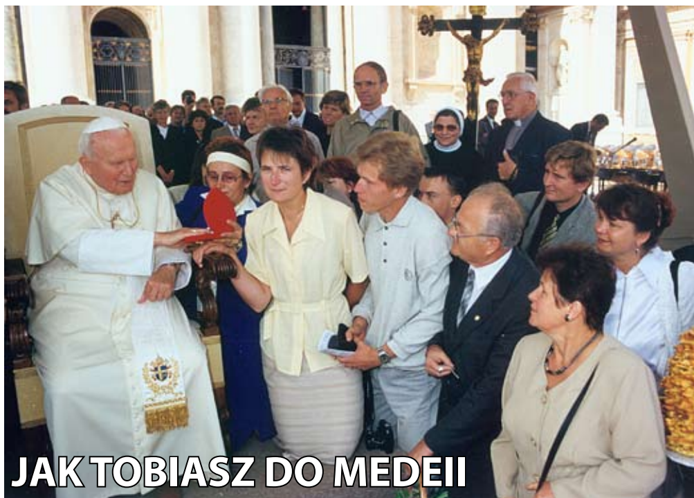
For. Arturo Mari