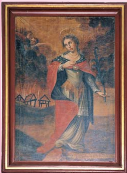
Nad ołtarzem obraz św. Agaty z połowy XVIII w.