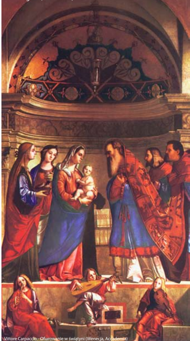
Vittore Carpaccio - Ofiarowanie w świątyni (Wenecja, Accademia)

„Teraz, o Władco, pozwól odejść słudze Twemu w pokoju..., bo moje oczy ujrzały Twoje zbawienie..., światło na oświecenie pogan i chwałę ludu Twego...” (Łk 2. 29-32)