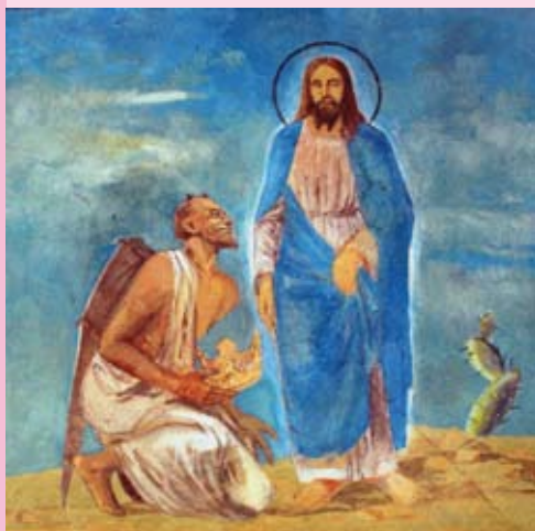
Na sklepieniu kaplicy fresk wyobraża „Kuszenie Chrystusa”