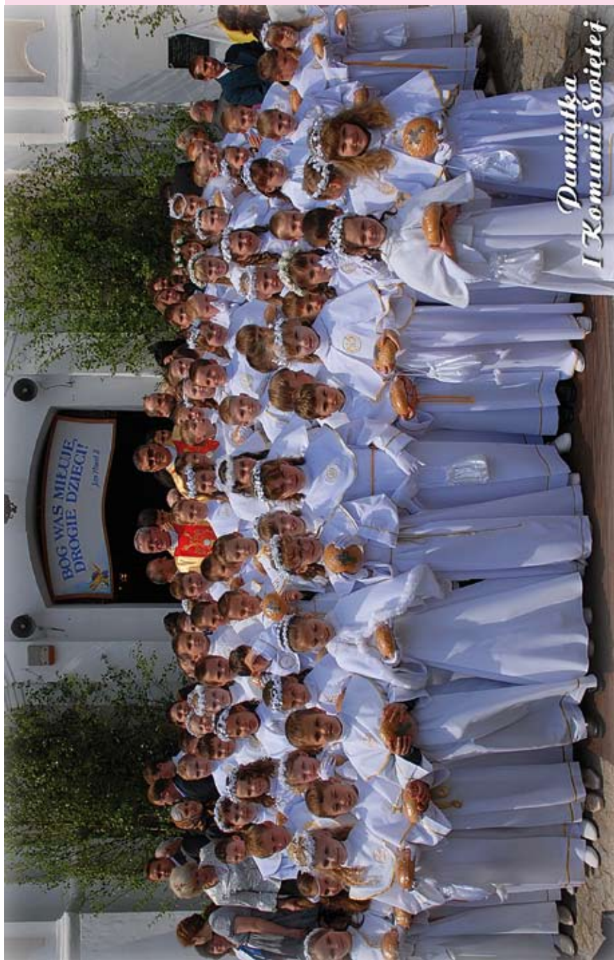
Pierwszy Pełny udział w Eucharystii dzieci naszej Parafii 16 maja 2010, w uroczystość Wniebowstąpienia Pańskiego